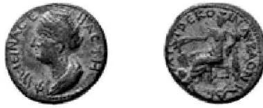
Abb. 2: Lykaonien, Ilistra, Faustina I.