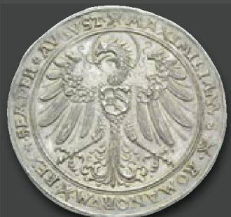
Kurfürstentum Sachsen Friedrich III. der Weise, 1486 – 1525. Breiter Gulden-groschen o. J. (nach 1507) mit Titel Maximilians I., auf die Generalstatthalterwürde. RR. Vorzüglich.