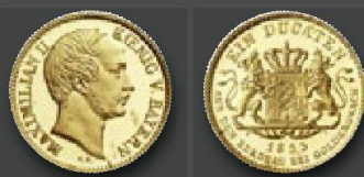
Königreich Bayern Maximilian II., 1848 – 1864. Dukats 1855. Spätere Prägung zur Erinnerung an die Goldkronacher Ausbeute. Von allergrößter Seltenheit. Vorzüglich.