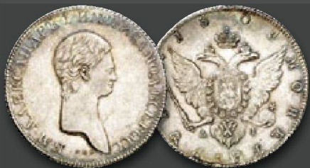
Kaiserreich Russland Alexander I., 1801 – 1825. Rubel 1801, St. Petersburg (Bankmünzstätte). Probe. Von größter Seltenheit. Vorzüglich +.