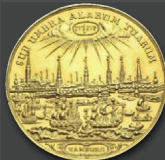
Stadt Hamburg Bankportugalozer zu 10 Dukaten 1689 von J. Reteke. RR. Fast Stempelglanz.