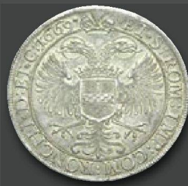
Italien, Ronco Napoleone Spinola, 1647 – 1672. Scudo 1669. Von größter Seltenheit. Vorzüglich.