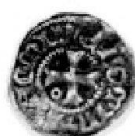
Fig. 3: Esterlin de l'atelier de Randers.

En ce qui concerne les lieux de découverte des trouvailles fribourgeoises, tirer des enseignements statistiques sur la base d'un corpus de quatre monnaies peut sembler saugrenu. Malgré tout, il n'est pas inutile de souligner les caractéristiques