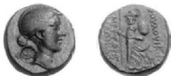
Abb. 7: Eumeneia (als Fulvia), Zmertorix (41/40 v.Chr.), RPC I 3139.

Kontext verwundert bei genauerer Analyse nicht unbedingt: Die von Attalos II. gegründete Stadt besass ja eine Phyle namens Athenais , die wohl nach der pergamenischen Athena Nikephoros benannt war 24 . Auf den Münzen von Eumeneia spielte Athena weiters schon seit der hellenistischen Zeit eine wichtige Rolle. Sie schmückte damals die Averse häufiger Bronzen 25 ; 41/40 v.Chr. bildete sie dann den Rückseitentyp der bekannten Fulvia-Prägungen des Zmertorix aus