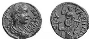
Abb. 10: Volusianus (251–253 n.Chr.), Eukarpeia, Typ SNG Aulock 3581.