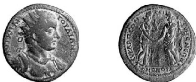
Abb. 1: Gordianus III. (238–244 n. Chr.), Eukarpeia, Homonoia-Prägung mit Eumeneia, unpubliziert. Privatsammlung «Abacus».