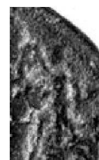
Abb. 3: Wie Abb. 1, Ausschnittvergrößerung des Reverses: Statuette von Eumeneia.