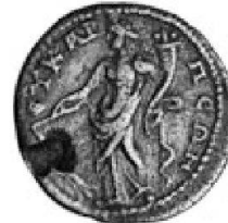
Abb. 4: Gordianus III. (238–244 n.Chr.), Eukarpeia, RPC 719.