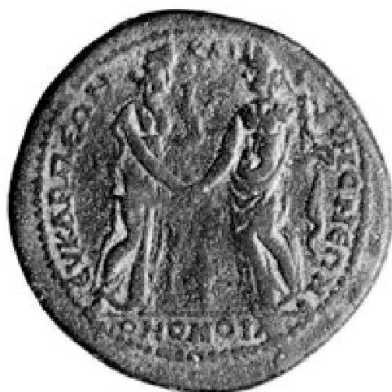
Abb. 1a: Wie Abb. 1, Revers, Vergrößerung (150%).

Orichalcum; Gewicht 26,05 g; Stempelstellung 7 Uhr; maximaler Durchmesser 35,3 mm