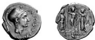
Abb. 9: Rom, Republik, Denar des Cn. Cornelius Blasio (ca. 112/111 v.Chr.), RRC 296/1i.

dieser Stadt (Abb. 7) 26 , und auch auf dem Revers pseudo-autonomer Prägungen von Eumeneia aus der hohen Kaiserzeit tritt sie auf (vgl. Abb. 8). Ihre Attribute auf unserem neuen Stück sind schlecht auszunehmen. In der erhobenen Rechten wird sie wohl einen Kranz halten; zu dieser Interpretation stimmt auch die Körperhaltung der kleinen Figur insgesamt. Diese Darstellungsform der Athena/Minerva begegnet zwar nicht häufig, ist jedoch auch auf Münzen gut belegt (Abb. 9) 27 . In der Linken könnte die Göttin vielleicht ihrerseits eine Statuette – der Nike? – tragen, doch muss das für den Moment aufgrund der Kleinheit der Darstellung unsicher bleiben 28 . Dass sich in Eumeneia ein wichtiges Athena-Heiligtum befunden haben wird, ist angesichts der geschilderten Bedeutung der Göttin für die Stadt selbstverständlich; streng numismatisch betrachtet ist es wohl auch mittels eines Analogieschlusses aus der Statuette abzuleiten, die die Tyche von Eukarpeia