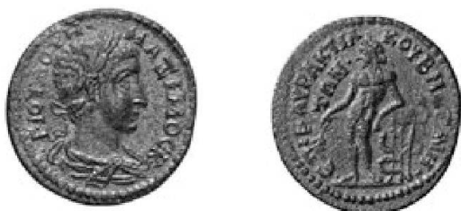
Fig. 3: Magnésie, Maxime (AE, 31 mm; 9,65 g)

peut-être parfois remplacé par le devin éponyme 22 . En revanche le trépied avec le serpent se retrouve ponctuellement à Mallos avec Amphilochos 23 , à Tarse 24 , et plus loin à Patara 25 , en Lycie, en liaison avec le culte local d'Apollon Patareus 26 , mais aussi en Ionie, à Magnésie du Méandre précisément pour Maximin et Maxime (fig. 3) 27 , en Phrygie à Thementhyrae ou à Docimeium 28 , en Pamphylie à Pergé 29 . Cependant les parallèles les plus frappants, à ma connaissance, ne se trouvent pas en Cilicie, mais en Pisidie: ce sont des bronzes émis par Etenna 30 pour Maximin 31 , puis pour Herennia Etruscilla 32 et Volusien 33 , qui présentent le même carton dans un style assez proche (fig. 4).