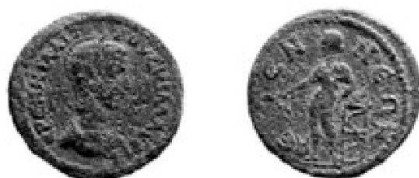
Fig. 4: Etenna, Herennia Etruscilla (AE, 24 mm; 5,15 g)

Syedra se trouvait dans une zone à la frontière flottante 34 , et elle était notamment très attirée par la Pamphylie d'un point de vue à la fois géographique et ethnique comme le laisse entendre une inscription qui parle des «Pamphylie de Syedra» (ΠΑΜΦΥΛΟΙ ΣΥΕΔΡΗΣ) 35 . K. Kraft a en outre montré la proximité existant sur le plan numismatique entre Sidé, Pergé, Etenna et Syedra 36 : on ne s'étonnera pas de voir apparaître à Etenna 37 un revers si proche de celui de Syedra.