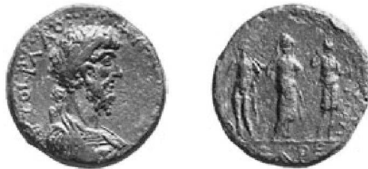
Fig. 2: Syedra, Lucius Verus (AE, 31 mm; 21,04 g)

Il est vraisemblable qu'Apollon apparaissait déjà dans le monnayage de Syedra sous les Antonins, à l'époque de Marc Aurèle et de Lucius Verus, au moment où, dans cet atelier, les sujets de revers se multiplient et se diversifient 12 , et peut-être même quelques décennies plus tôt, sous Hadrien 13 . Parmi les premières attestations du thème apollinien à Syedra, on trouve tout d'abord le cas d'Apollon Sidètès 14 : le dieu se reconnaît aisément 15 à sa posture et à ses vêtements et les hésitations au sujet de l'identification de cette divinité 16 peuvent être levées. Il existe par ailleurs une monnaie inédite où l'on distingue Apollon dans une posture caractéristique 17 : cette pièce montre Artémis et son frère encadrant une divinité de face (Létô ou Asclépios) 18 . Apollon porte un arc dans la main gauche et sa main droite devait tenir une branche d'olivier: c'est un Apollon Daphnéphoros 19 assez proche de celui du bronze de Maxime (fig. 2).