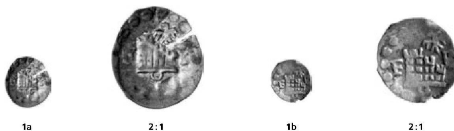
Abb. 1: Freiburg i.Üe., Stadt, Schüsselpfennig o. J. vom Typ Morard/Cahn/Villard 22.

Eine Schweizer Kleinmünze, deren Datierung in den Referenzwerken etwas Mühe bereitet, ist der Schüsselpfennig von Freiburg im Üechtland, den N. Morard, E. Cahn und Ch. Villard in ihrem grundlegenden Werk zur Freiburger Münzgeschichte als Maille bzw. Halbpfennig unter der Nummer 22 in die Prägeperiode 1476–1529 setzen 1 . In einer Anmerkung präzisieren sie, dass die Münze möglicherweise bis ins 16. Jahrhundert hinein geprägt wurde. Die Münze zeigt die Freiburger Burg über einem kleinen (Halb-) Ringel und zwischen den Buchstaben F – B, darüber rechts einen kleinen Adler mit nach links gewandtem Kopf. Das Bild ist von einem groben Perlkreis umgeben. Dieser Münztyp ist flach und schüsselförmig belegt.