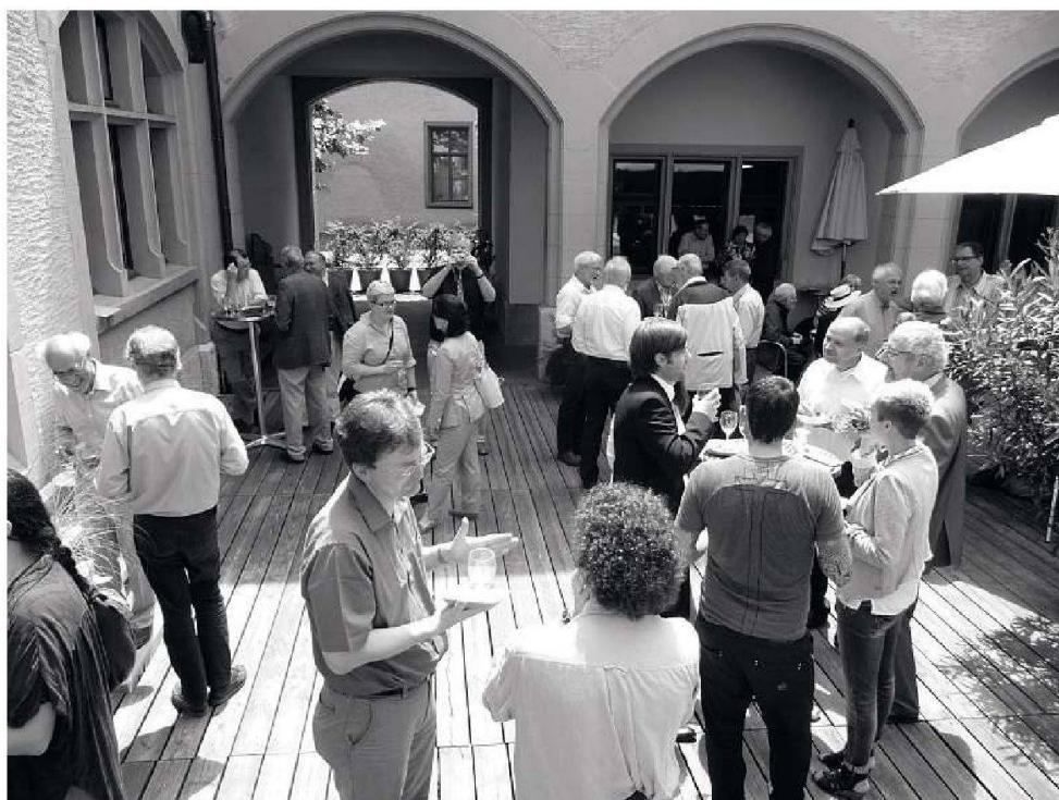
Abb. 2: Geselliges Beisammensein im Innenhof des Museums für Musik.