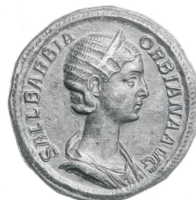
Sallustia Barbia Orbiana, sestertice de bronze