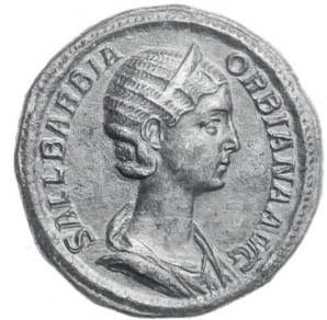
Sallustia Barbia Orbiana, sestertie de bronze