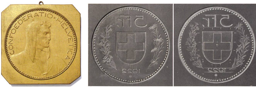
Abb. 19 und 20: Goldfarbig lackiertes Gipsmodell mit dem Alpirthen, Durchmesser Münzbild 103 mm und zwei Wertseitenentwürfe, 1922, in Schiefer, Durchmesser 80 mm.

neuen Entwürfe aus dem engeren Wettbewerb. Es entschied, dass ein Entwurf des Bildhauers Maurice Sarkisoff aus Genf (1882–1946; Vorderseite: Kopf eines