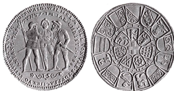
Abb. 1: Bundestaler von Hans Jakob Stampfer, Vorderseite Rütli, Rückseite im Zentrum das Schweizerkreuz, darum herum angeordnet die Wappen der 13 Urkantone in ihrer historischen Reihenfolge.