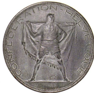
Abb. 10: Bronzemodell des Entwurfs mit Fahne von 1919, Durchmesser 103 mm.

Kapuze über und passte die Schrift an. Auf einem weiteren Entwurf statt er den Hirten mit einer langen Hose aus. Die Schrift «CONFOEDERATIO – HEL-