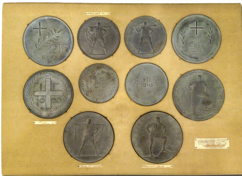
Abb. 18: Tafel mit zehn Bronzemodellen von Paul Burkhard. Oberhalb des kleineren Entwurfs mit Fahne ist auf einem aufgenagelten Schildchen handschriftlich vermerkt: «PRÄMIE, 600 Fr., 17. Jan. 1918». Dies ist offensichtlich ein Fehler, denn prämiert wurde der Entwurf «Morgenstern». Möglicherweise wurden auch die beiden Modelle nachträglich vertauscht. Unter dem Einfranken-Entwurf von 1920 steht auf einem Schildchen: «z. AUSFÜHRUNG vorgeschlagen 1918», unter dem grösseren Entwurf mit Fahne ist zu lesen: «PRÄMIE, 500 Fr., 26. Nov. 1922» und unter dem Hirten in kurzer Hose und Kapuze: «PRÄMIE, 600 Fr., 17. Jan. 1918, z. AUSFÜHRUNG vorgeschl.». Letzteres ist ebenfalls nicht korrekt. Beim prämierten Entwurf handelt es sich nämlich um den Hirten ohne Kapuze (vgl. Abb. 3). Die ganze Tafel ist unten rechts mit einem Schildchen mit folgendem handschriftlichen Vermerk versehen: «MÜNZ-ENTWÜRFE, BRONZEGÜSSE in SCHIEFER negativ geschnitten und von mir patiniert. Paul Burkhard, München 1918/19». In der Mitte oberhalb der unteren beiden Entwürfe ist auf der Unterlage ein kreisförmiger Schatten mit einem Durchmesser von 37 mm erkennbar. Möglicherweise war hier früher eine Probeprägung des Alphirten angebracht.

Ein weiteres Projekt für eine Wertseite zeigt im Zentrum einen Eichenzweig, darüber das Schweizerwappen, das Kreuz mit Strahlen versehen. Unter dem Zweig ist in zwei Linien «5 Fr.» / «1922» und ganz unten das Münzzeichen «B» angebracht. Vgl. dazu Abb. 10; der linke darauf abgebildete und früher einge-