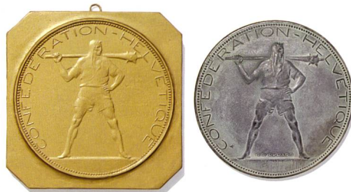
Abb. 4: Goldfarbig lackiertes Gipsmodell «Morgenstern» und entsprechendes Bronzemodell, Durchmesser Entwurf: 102 mm.

Vom Alpherthen mit Morgenstern besitzen wir zwar keine Tafel, dafür ein goldfarbig lackiertes Gipsmodell. Der Hirte, wiederum von vorne, steht die Beine gespreizt, barfuss auf flachem Grund, den Kopf nach rechts gerichtet. Er trägt eine kurze Hose, ein Hirtenhemd mit über den Kopf gezogener Kapuze und über der rechten Schulter einen Morgenstern. Der rechte Arm hält den Schaft der