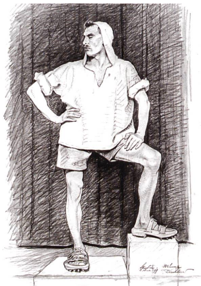
Abb. 7: Um die Figur des Alpbirten möglichst naturgetreu herauszubringen, begab sich der in München wohnhafte Paul Burkhard für Modellstudien in die Urschweiz. Die Unkosten der Reise wurden vom Eidgenössischen Finanzdepartement übernommen. Die abgebildete Skizze zeigt den Alpbirten am Berg mit übergezogener Kapuze und kurzer Hose signiert mit «Studie Münze, 2. Juli 19, P. Burkhard».

Es war geplant, dass das Preisgericht zur Begutachtung des abgeänderten Entwurfs der Vorderseite und des neuen Entwurfs der Rückseite im Laufe des Jahres 1919 noch einmal zusammenkommen sollte. Eingehende Modellstudien von Paul Burkhard sowie verschiedene andere Umstände verzögerten dies. Im April 1920 reichte er dann eine reiche Auswahl neuer Entwürfe ein, nämlich