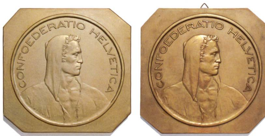
Abb. 25: Gipsmodell mit der Hirtenbüste für den Fünfliber 1924, Durchmesser Münzbild 166 mm und Bronze- modell für die Reduktion in gleicher Grösse mit angelötetem Aufhänger.