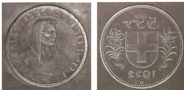
Abb. 16 und 17: Entwurf «Hirtenbüste», Durchmesser 90 mm und Fünffranken-Wertseitenentwurf, 1922, Durchmesser 80 mm, beide haben bereits Ähnlichkeit mit den definitiven Entwürfen.

Ein Wertseitenentwurf, der ebenfalls grosse Ähnlichkeit mit dem späteren