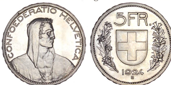
Abb. 26: 5 Franken 1924. Deutlich erkennbar das markantere Relief und die neugestaltete Wertbezeichnung.

Vom neuen Entwurf der Bildseite liegen der Münzstätte ein bronzefarbig