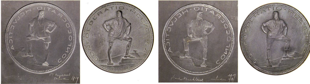
Abb. 8 und 9: Entwurf «Berg» mit Alphirten mit übergezogener Kapuze in kurzer Hose, Durchmesser 122 mm, signiert P. Burkhard, München, 1919 und in langer Hose, Durchmesser 121 mm, signiert Paul Burkhard, München, 1919/1920, jeweils mit dem entsprechenden Bronzemodell.

Wie von der Jury gewünscht, zog Paul Burkhard dem Hirten am Berg die