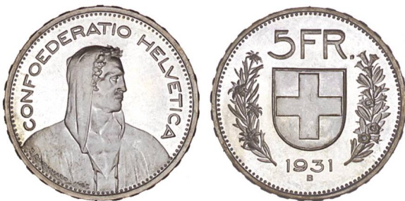
Abb. 27: 5 Franken 1931, reduziert nach den leicht angepassten Modellen von 1924.