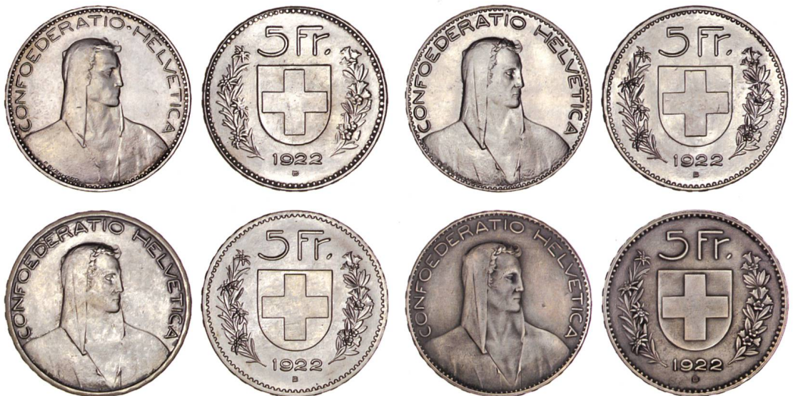
Abb. 22: 5 Franken 1922: links oben Probeprägung mit rautenförmigem Bindestrich zwischen CONFOEDERATIO und HELVETICA, rechts die definitive Prägung mit dem falsch proportionierten Kreuz, darunter eine Probeprägung ohne Randperlen auf der Bildseite, dafür mit breiterem Rand, vermutlich als Reaktion auf den durch das wiederholte Umsenken zu schmal gewordenen Randstab sowie eine patinierte Version der endgültigen Prägung. Letztere wurde wahrscheinlich in der Absicht produziert, die schwache Zeichnung des Reliefs besser hervorzuheben. Offensichtlich vermochten beide Proben nicht zu überzeugen.

Das Gravieratelier der Swissmint hat die Reliefhöhen des Gipsmodells mit der Hirtenbüste mit denjenigen der Versuchsprägung verglichen. Diese entsprechen