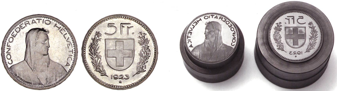
Abb. 23 und 24: 5 Franken 1923: mit verbesserten Stempeln geprägt. Die Proportionen des Kreuzes entsprechen nun den Vorgaben. Rechts davon die Prägestempel.

Es erstaunt daher nicht, dass die Ende 1922 der Münzstätte angelieferten Probestempel nicht tel quel verwendet werden konnten. Um den Anforderungen als Prägestempel in technischer Beziehung zu genügen, mussten mehrfache