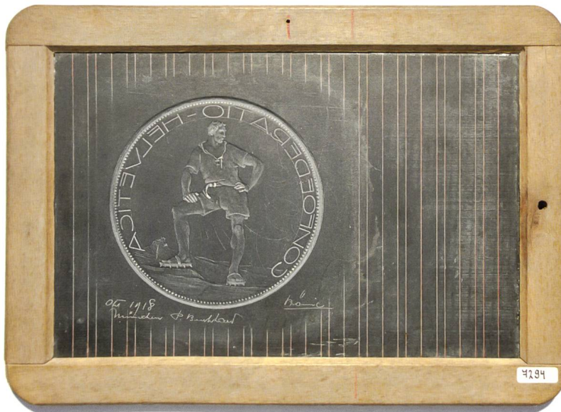
Abb 3: In Schiefertafel gravierter Entwurf «Berg», Durchmesser Entwurf: 109 mm, Masse Schiefertafel: 205 x 285 mm.

RATIO – HELVETICA», am Rand Perlenkranz. Der Entwurf ist wie folgt signiert: Links unten unter dem Entwurf: «Okt 1918 / München, P. Burkhard», rechts unten steht der offenbar nachträglich angebrachte Vermerk «Prämie».