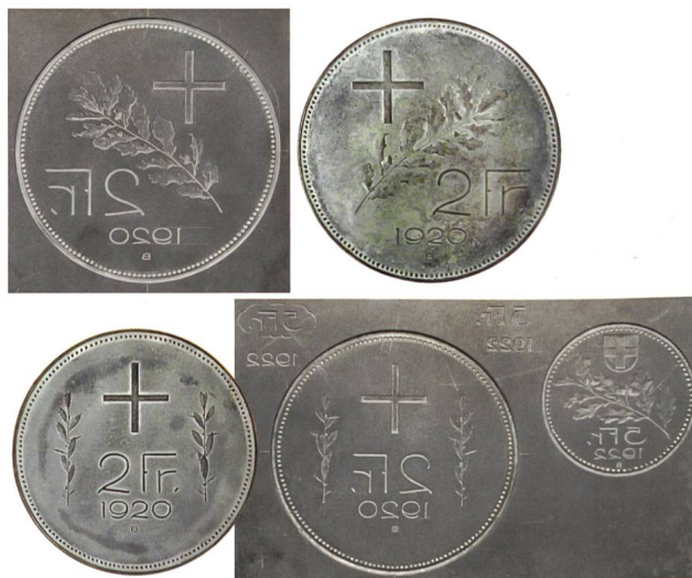
Abb. 11 und 12: Zwei Zweifranken-Wertseitenentwürfe, 1920, in Schiefer, mit Eichenzweig, Durchmesser 118 mm und mit Lorbeerzweigen, Durchmesser 117 mm, mit den entsprechenden Bronzemedellen. Rechts späterer Fünffranken-Wertseitenentwurf, 1922, Durchmesser 74 mm.

nicht vollends zu überzeugen. Die beiden 2-Franken-Entwürfe zeigen ein mittelgrosses, langarmiges und sehr schlankes Schweizerkreuz einmal rechts oben angebracht, darunter ein diagonal nach links ansteigender Eichenzweig, links davon die Wertangabe «2 Fr.», unten in der Mitte die Jahrzahl «1920» und darunter klein das Münzzeichen «B». Der andere Entwurf hat unter dem in der oberen Bildhälfte positionierten Kreuz in drei Zeilen die Wertangabe «2 Fr.», «1920» und «B», das Ganze flankiert von zwei Lorbeerzweigen. Das Kreuz weicht damit deutlich von der im Bundesbeschluss von 1889 festgelegten Form ab, nach welcher die unter sich gleichen Arme des Kreuzes je um einen Sechstel länger sind als breit 16 . Ebenso wenig berücksichtigt es den Vorschlag der Jury, die als Vorbild die Kreuzform auf der Stampfer'schen Medaille (vgl. Abb. 1) empfohlen hatte. Das Kreuz auf den Entwürfen orientiert sich vielmehr an historischen Feldzeichen der Schweiz. Ein weiterer 1-Franken-Entwurf zeigt im Zentrum ein sehr grosses, langarmiges und schlankes Schweizerkreuz umgeben von einem Lorbeerkranz. Die Wertangabe «1 / F.» wird durch den oberen Kreuzschenkel