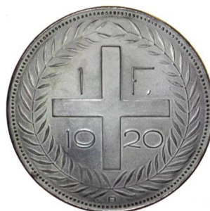
Abb. 13: Bronzemedell eines Einfranken-Wertseitenentwurfs mit Jahrzahl 1920, Durchmesser 118 mm.