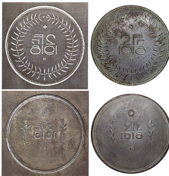
Abb. 5 und 6: Zwei in Schiefertafeln gravierte Zweifranken-Wertseitenentwürfe mit den entsprechenden Bronzemodellen, Durchmesser 95 mm und 104 mm.

aus Ölweigen, den anderen zwei mickrige Lorbeerzweige links und rechts von der Beschriftung. Beide Entwürfe tragen das Münzzeichen «B» und einen Perlenkranz.