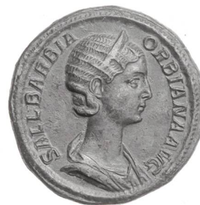
Sallustia Barbia Orbiana, sestercer de bronze