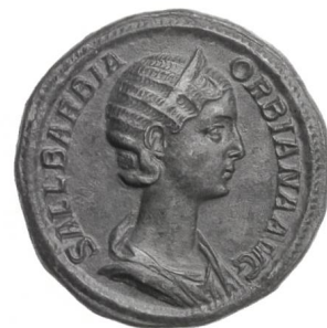
Sallustia Barbia Orbiana, sesterce de bronze