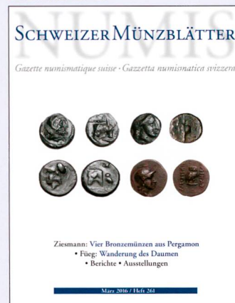
Revue Suisse de Numismatique