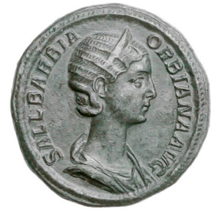
Sallustia Barbia Orbiana, sesterce de bronze