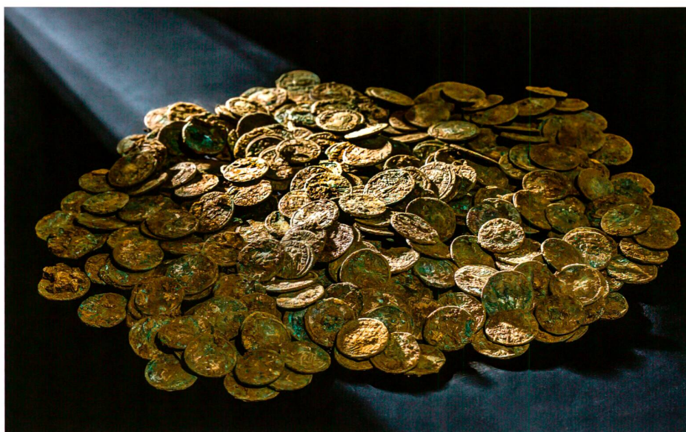
Abb. 1: Ueken AG, 2015: Übersicht.

1970er Jahren durch maschinelle Aushubarbeiten einer Drainageleitung teilweise umgelagert worden war, ohne dass dies damals aufgefallen wäre. Allerdings schränkt dies eine mögliche Aussage zur ursprünglichen Lagerung und allenfalls zur inneren Struktur und Mikrostratigraphie stark ein; selbst die absolute Vollständigkeit ist nicht gesichert. Immerhin wurden während der Grabung Fragmente von mindestens zwei Keramikgefässen gefunden, Reste eines zweihenkligen Krugs und einer Reibschüssel. Zumindest ein Teil des Fundes war ursprünglich im Krug gelagert.