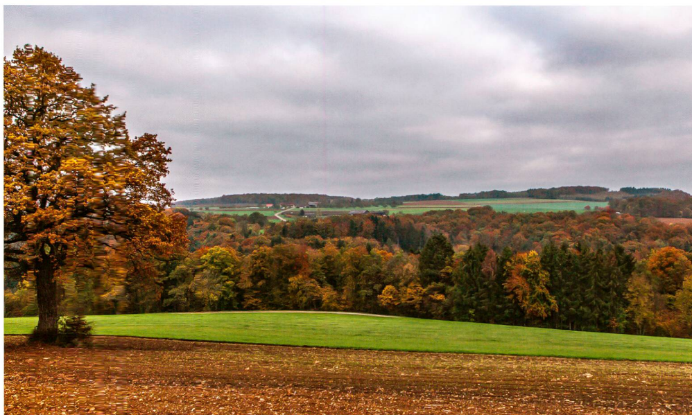
Abb. 2: Ueken AG, 2015: Die Fundstelle Chornberg mit Zassehaldehof; Blick von Südosten.