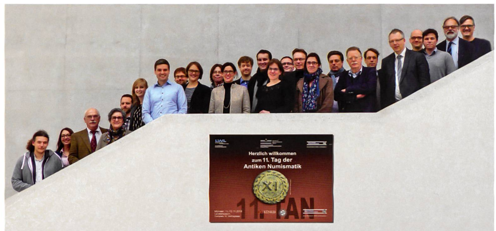
Gruppenbild der Referenten und Veranstalter des 11. TAN.