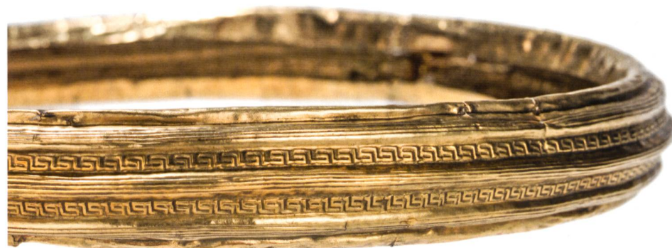
Fig. 1: Torque en or de la tombe de Payerne (Suisse, Vaud), VI e siècle av. J.-C.

Après plusieurs expositions hors les murs,