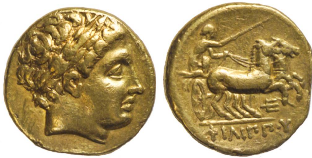
Fig. 2: Statère posthume de Philippe II de Macédoine, 323–317 av. J.-C. (échelle 2:1).

une première exposition permanente portant le nom évocateur de « Collections monétaires » est réalisée en 1997. En 2015, elle est entièrement actualisée et devient « Par ici la monnaie! », un parcours ludique qui mêle Histoire et Économie.