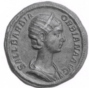
Sallustia Barbia Orbiana, sesterce de bronze