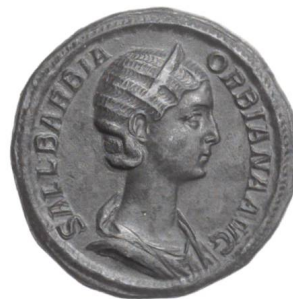
Sallustia Barbia Orbiana, sesterce de bronze