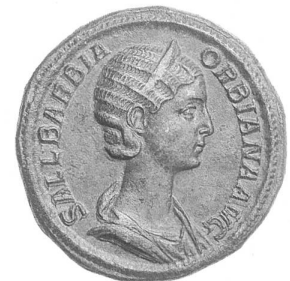
Sallustia Barbia Orbiana, sesterce de bronze