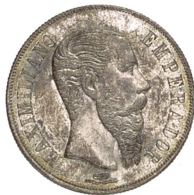
Abb. 2: Peso des Kaisers Maximilian von Mexiko, Mexico-Stadt 1864.

Ein solches Beispiel ist der ab etwa 1150 in Hall am Kocher (Schwäbisch-Hall, D) geprägte neue Pfennigtyp, der auf der einen Seite eine Hand, auf der anderen ein Kreuz trug, der Haller, resp. Heller. Dienlich war dieser wegen seines geringen Werts vor allem im täglichen Handel. Die grosse Nachfrage nach solchen Münzen führte dazu, dass der Heller bald an zahlreichen Orten geprägt wurde und sich weit verbreitete, auch in der Schweiz.