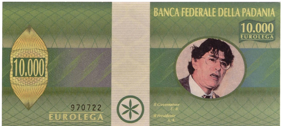
Abb. 3: Fantasie-Banknote von Padanien mit dem Portrait von Umberto Bossi.