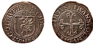
Abb. 1: Greyerz, Graf Michael, Groschen/Gros von 1552 (Expl. Museum Schloss Greyerz).

Die Greyerzer Münzen hatten eine sehr kurze Umlaufzeit. Heute sind 26 Exemplare der Greyerzer Münzen aus schweizerischen und ausländischen Sammlungen bekannt (Abb. 1). Es handelt sich dabei um sogenannte Groschen aus Billon, zwei davon sind vergoldete Billon-Stücke 5 .