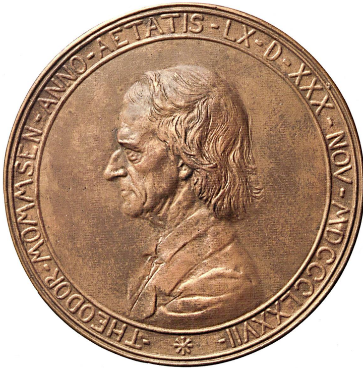
Abb. 1: Galvano der einseitigen Medaille zum 60. Geburtstag Mommsens, 1877, von Reinhold Begas. Dm. 13,4 cm; Tüb. Inv. VI 307/16a. KRMNICEK (Hrsg.) 2017 Nr. 1.