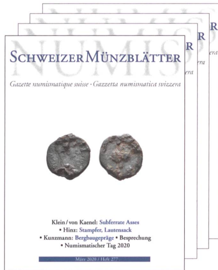
Gazette numismatique suisse