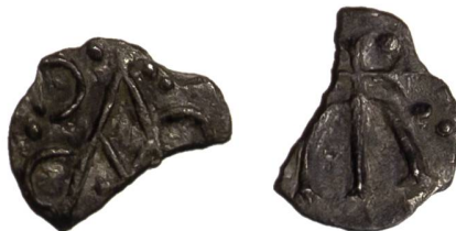
Fig. 2: denier inédit attribuable à Melle trouvé près du Château d'Hegi, fragment de 0,51 g, 13,9 mm, 9 h. Kantonsarchäologie Zürich, FmZH, LNr. 10017, échelle 2 : 1.

Parallèlement aux fouilles, les environs est et nord-est ont également été prospectés au détecteur de métaux. R. Baum, bénévole de l'Archéologie cantonale, y a trouvé, le 23 juin 2019, le denier mérovingien présenté ici ( Fig. 2 ). En tant que découverte hors de la zone de fouille, la pièce n'a malheureusement pas de contexte archéologique plus précis et se trouvait dans l'humus récent, à quelques centimètres au-dessous de la surface.