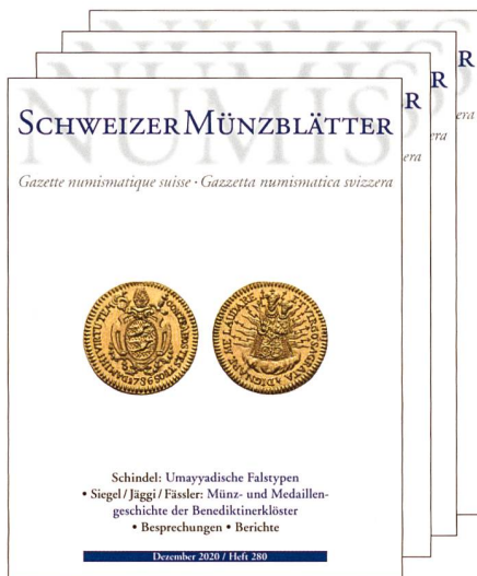
Gazette numismatique suisse