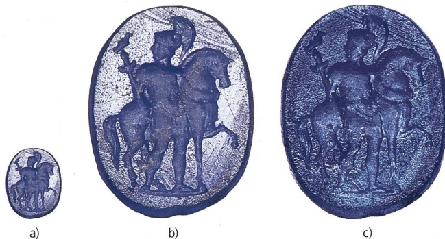
Abb. 1: Gemme aus blauem Glas mit Bild eines Reiters mit Adlerstandarte. Grabung Windisch-Zürcherstrasse (Urech) 2017–2018 (V.017.5), Inv.-Nr. V.017.5/278.1. a) Mst. 1:1 b) Mst. 3:1, fotografiert mit starkem Streiflicht c) Mst. 3:1, fotografiert mit Durchlicht.

Bei Ausgrabungen in Windisch/ Vindonissa (AG) sind in den letzten Jahren eine ganze Reihe von neuen Gemmen ans Licht gekommen. Sie ergänzen den letztmals 1952 publizierten Bestand aus Vindonissa beträchtlich, konnten bislang aber nur in Einzelfällen vorgelegt werden 4 . Eine davon soll im Folgenden etwas ausführlicher vorgestellt werden.