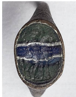
Abb. 3: Gemme aus grün-blau-weiss gestreiftem Glas mit Bild eines Reiters mit Adlerstandarte, gefasst in einem Fingerring aus Buntmetall. Museum August Kestner, Hannover, Inv.-Nr. K 1323. Mst. 3:1.

Die Entstehungszeit der Glasgemme selbst kann aufgrund des Stils der Vorlage, nach der sie abgedrückt wurde, sowie wegen des Materials einer Parallele zeitlich näher eingegrenzt werden. Reiter und Pferd sind gut proportioniert und plastisch ausgearbeitet. Vereinzelt sind kleine kugelförmigen Eintiefungen des Steinschneideinstrumentes zu erkennen, so z. B. an den Gelenken des Pferdes, im Gesicht des Reiters und an der Adlerstandarte. Die Vorlage, nach der die Glasgemme abgeformt wurde, lässt sich somit am ehesten dem feinen Rundperlstil oder klassizistischen Rundperlstil zuordnen, der ungefähr ins 1. Jh. v. Chr. datiert werden kann 8 . Für die Entstehungszeit unserer Glasgemme gibt dies wiederum nur einen ungefähren terminus post quem . Näher eingrenzen lässt sich die Entstehungszeit durch ein Vergleichsstück im Museum August Kestner in Hannover, welches das genau gleiche Bild zeigt, abgedrückt auf einer grün-blau-weiss gestreiften Glaspaste (Abb. 3) 9 . Die Gruppe dieser Glasgemmen mit ihrer auffallenden Farbgebung war in der ausgehenden Republik und in augusteischer Zeit besonders beliebt und verbreitet 10 . Die Entstehungszeit unserer blauen Glasgemme aus Vindonissa lässt sich somit ungefähr von der 2. Hälfte des 1. Jh. v. Chr. bis an den Beginn des 1. Jh. n. Chr. eingrenzen. Sie war also schon mindestens eine Generation in Gebrauch, bevor sie im Umfeld des Legionslagers Vindonissa verloren ging.