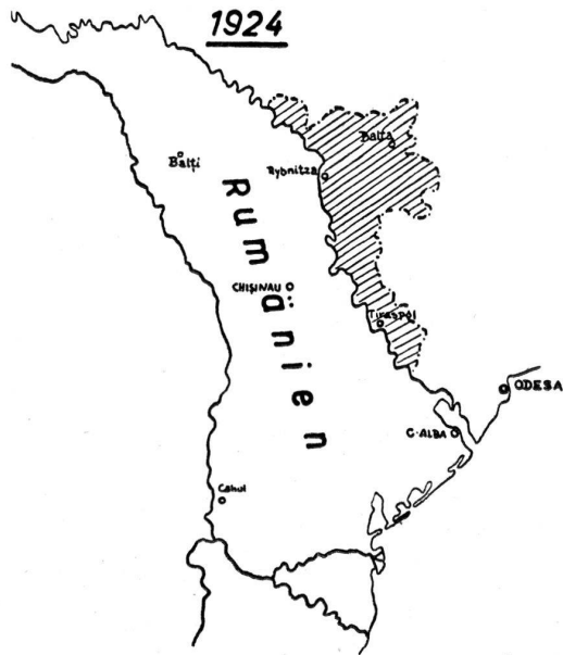
Die Moldauische Unionsrepublik 1924