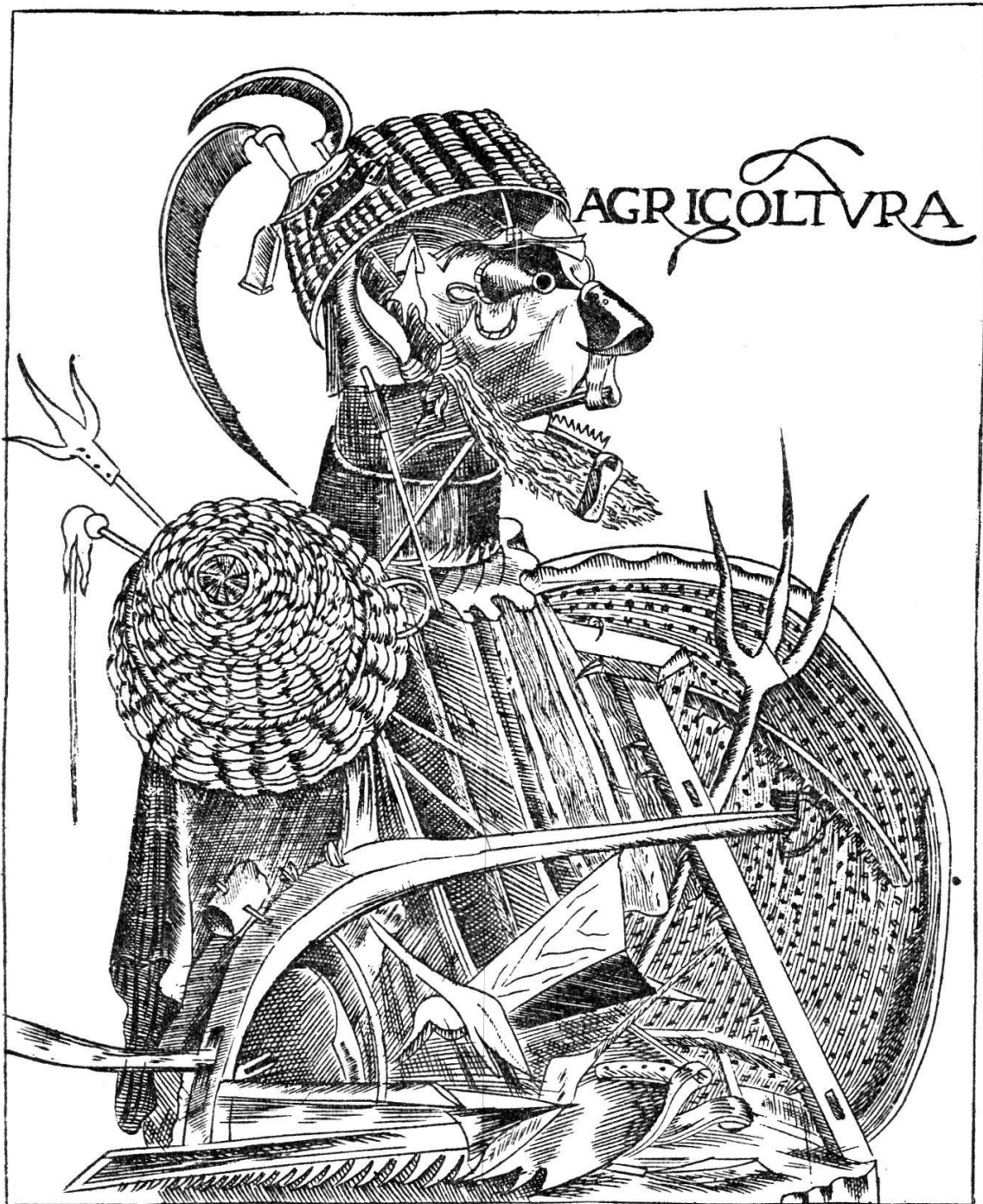
Agricultura. Nachstich nach Arcimboldos Entwurf für Camocio, publiziert von Angelo Salvatori. Kopenhagen, Kunstindustrimuseet

alles in Töne von feucht-grauer, wässerig unbestimmter Farbe zusammen, aus denen nur das Rot von Korallen und Krebsen herausleuchtet. Einen Bibliothekar montierte er aus Büchern, Heften, Buchzeichen und Staubwedel, die Physiognomie Calvins löst sich — zur Fratze verzerrt — aus zusammengesetztem Geflügel.