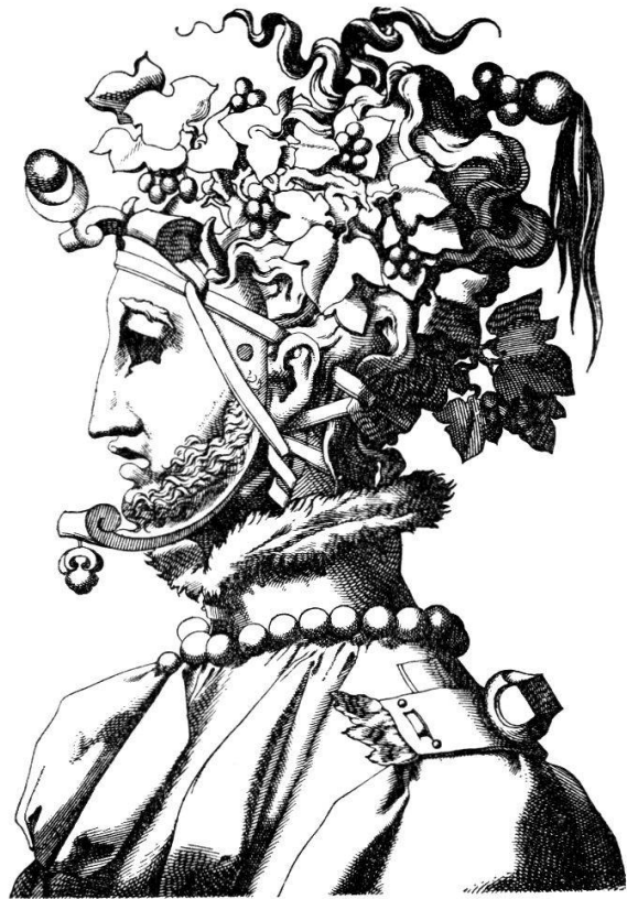
Groteskmaske, gestochen von André Boyvin(?), vor der Mitte des 16. Jhs. London, Brit. Mus.

ken, Rollwerk und starr ausgestochenen Ornamentformen zu grotesken Puppen montiert sind. Während des späteren 16. und frühen 17. Jahrhunderts werden Zeichner, Stecher und Dekorateure nicht müde, ihre Erfindungsgabe an solchen kapriziösen Gegenständen zu üben. Ein Spukreigen von skurrilen Gestalten aus der Phantasie Boschs und Brueghels bevölkert die Seiten der 1565 erschienenen Ausgabe von Rabelais' Songes drolatiques de Pantagruel . Tanzende Töpfe und auf ihren eigenen Schnäbeln blasende Dudelsäcke treiben ihren Unfug als Begleitung zu Rabelais' derber Unterhaltung, aggressiver Parodie