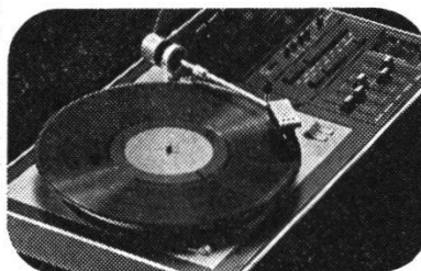
Gute Tonqualität – durch optimale Materialaufbereitung

Co-Polymer ist der Hauptrohstoff für die Schallplatte. Ihm werden Gleitmittel, Stabilisatoren und Russ – für die Farbgebung – beigemischt. Im richtigen Mengenverhältnis werden die Stoffe aus den Silos in die Heiz-Kühl-Mischkombination gegeben, wo sie unter Temperatur-