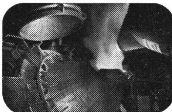
Im neuen AOD-Konverter entsteht hochlegierter Qualitätsstahl

gussstücke für Turbinen eine führende Stellung erobert. Gelingt es, mit kleinem zusätzlichem Aufwand die Eigenschaften eines bestimmten Produktes zu verbessern oder die Herstellungskosten zu senken, ist damit ein technischer Fortschritt erzielt.