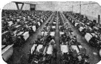
Websaal mit Schützenwebmaschinen Rüti - C1000

Geliefert werden nicht nur Werkzeugmaschinen, Textilmaschinen oder Giessereianlagen. Geliefert wird das Wissen um den Einsatz solcher Maschinen und Anlagen. Geliefert werden Analysen von Markt und Bedarf, Lösungsmöglichkeiten von Finanzfragen und Versorgungsproblemen, Einführung, Training und Ausbildung.