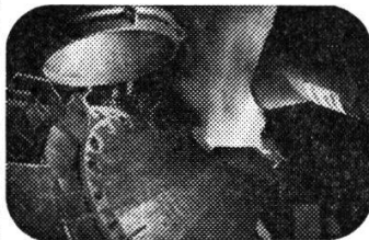
Im neuen AOD-Konverter entsteht hochlegierter Qualitätsstahl

Im Zeitstandlabor zum Beispiel hatte man in langwierigen Versuchen die Eigenschaften des Stahlgusses bei erhöhten Temperaturen ermittelt. Dank dieser Pionierleistung wurde auf dem Gebiet der Stahlgusstechnologie für Turbinen eine führende Stellung erobert. Gelingt es, mit kleinem zusätzlichem Aufwand die Eigenschaften eines bestimmten Produktes zu verbessern oder die Herstellungskosten zu senken, ist damit ein technischer Fortschritt erzielt.