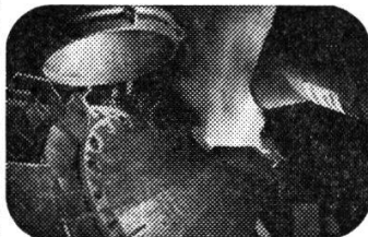
Im neuen AOD-Konverter entsteht hochlegierter Qualitätsstahl

Im Zeitstandlabor zum Beispiel hatte man in langwierigen Versuchen die Eigenschaften des Stahlgusses bei erhöhten Temperaturen ermittelt. Dank dieser Pionierleistung wurde auf dem Gebiet der Stahlgusstechnologie für Turbinen eine führende Stellung erobert. Gelingt es, mit kleinem zusätzlichem Aufwand die Eigenschaften eines bestimmten Produktes zu verbessern oder die Herstellungskosten zu senken, ist damit ein technischer Fortschritt erzielt.