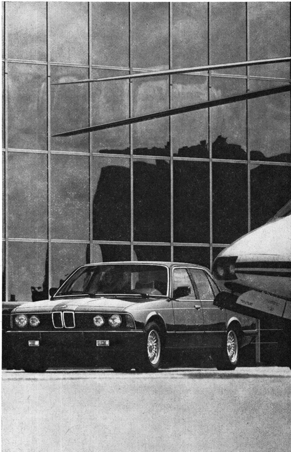
BMW 735i. Sonderausstattung: Leichtmetallfelgen mit TRX-Bereifung.