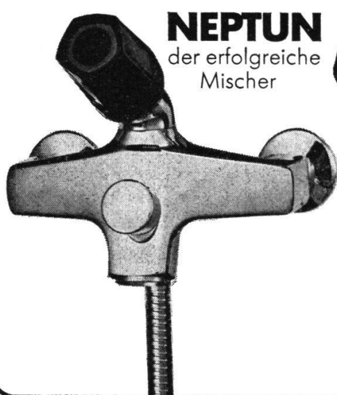
NEPTUN der erfolgreiche Mischer