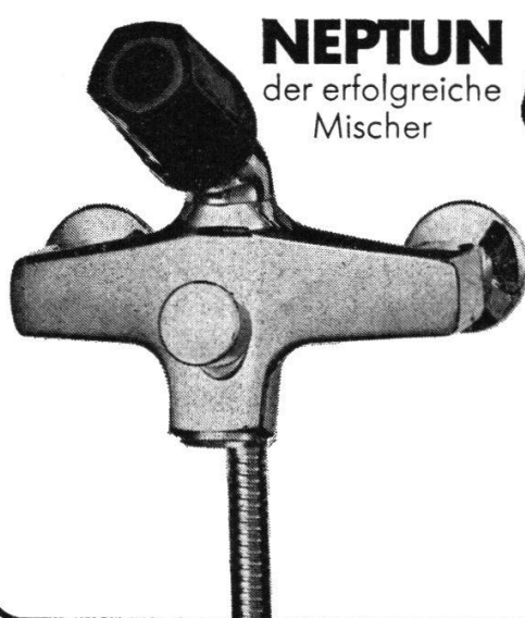
NEPTUN der erfolgreiche Mischer