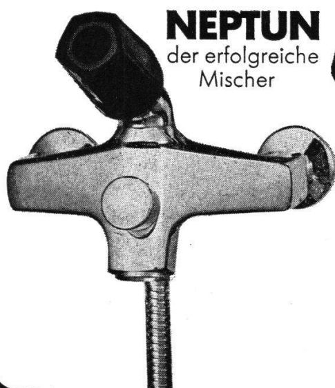
NEPTUN der erfolgreiche Mischer

W er KABA STAR-Schlüsselkopien unbefugtherstellt, macht sich strafbar. KABA STAR-Duplikate dürfen nur vom Werk und nur gegen Unterschrift der bezugsberechtigten Personen angefertigt werden. Das ist gesetzlich festgelegt. Durch in- und ausländische Patente. KABA STAR ist das Schliess-System, bei dem Sie ein wirklich sicheres Gefühl haben können. Auf lange Sicht. Mehr erfahren Sie bei Ihrem Beschläge- oder Eisenwarenhändler.