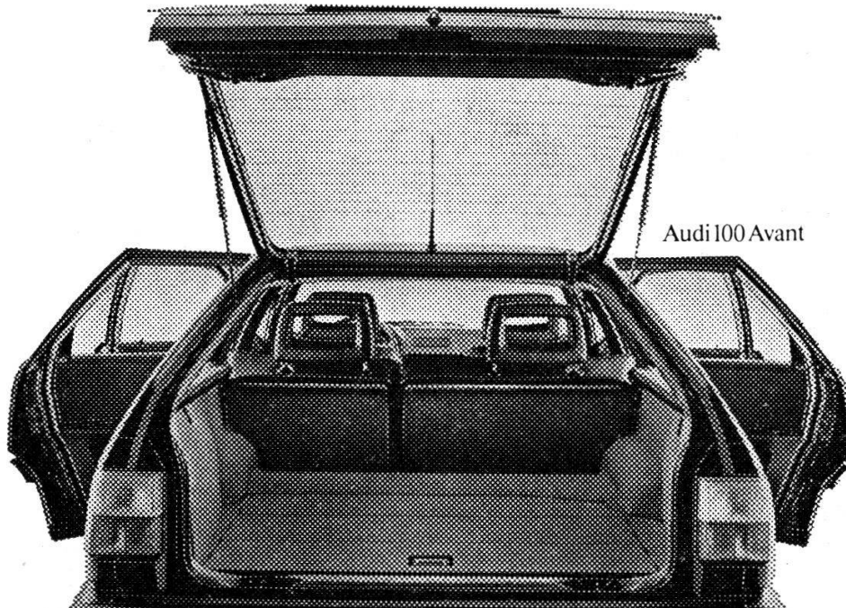
Audi 100 Avant

Audi 100 und Audi 100 Avant auch als quattro mit permanentem Allrad-Antrieb.