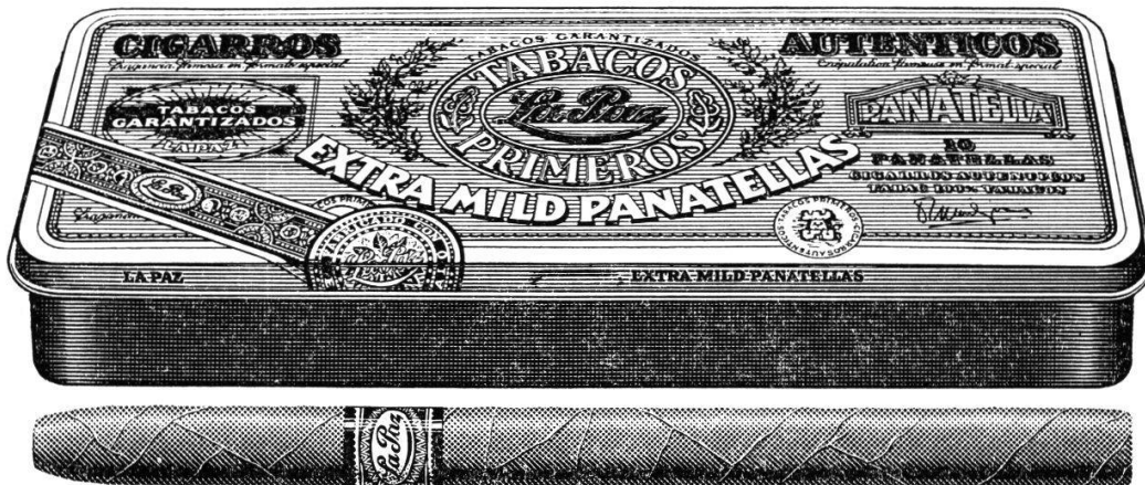
Extra Mild Panatellas von La Paz in 10er-Blechdosen Fr. 9.-. Nur im guten Fachhandel.

Es ist schon ein besonderes Vergnügen, kostbare Cigarren von vollendeter Form zu geniessen. Denn nichts geht über die Freuden von Auge und Gaumen.