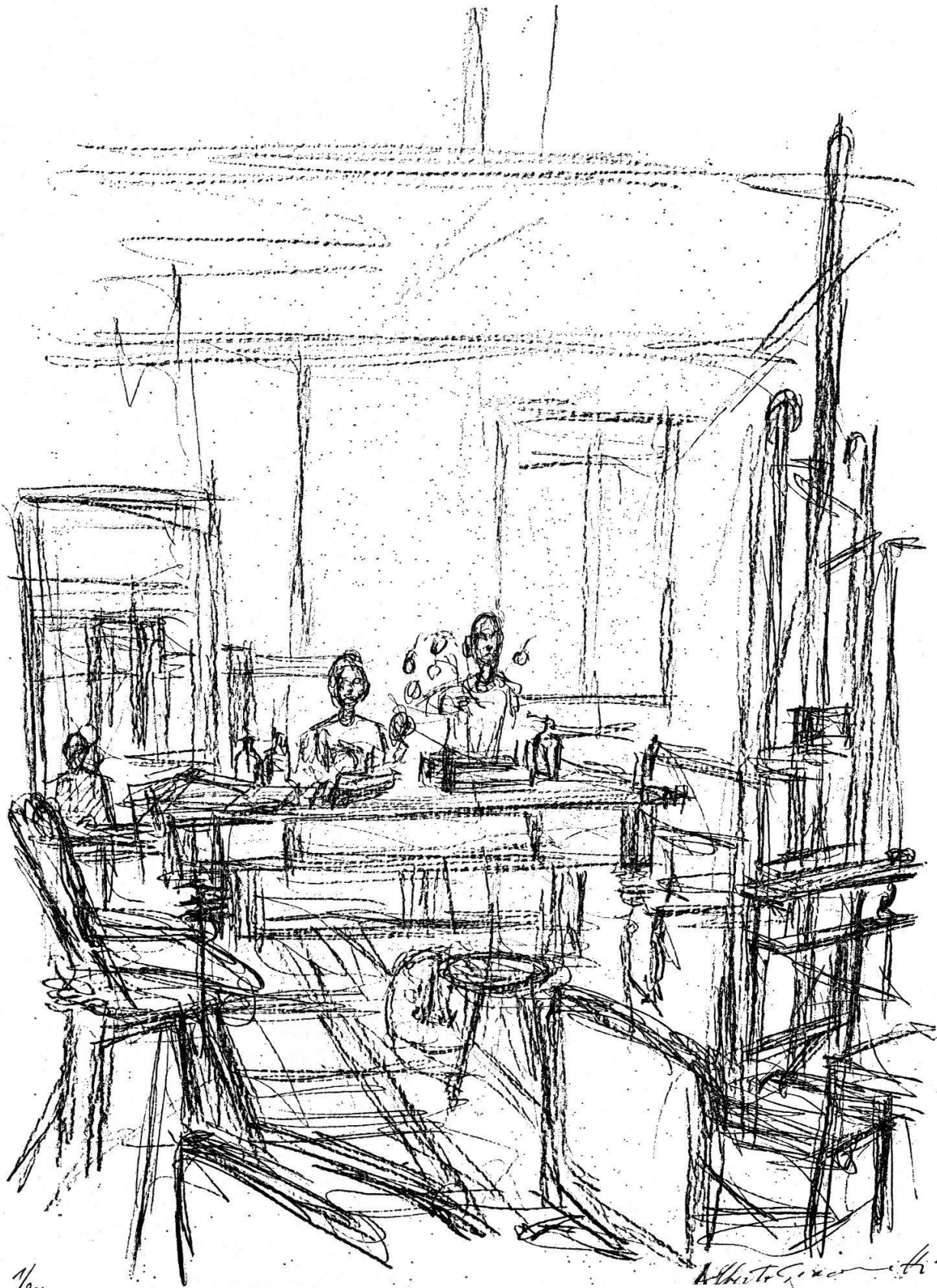
ATELIER, 1965 LITHOGRAPHIE VON ALBERTO GIACOMETTI (1901-1966)