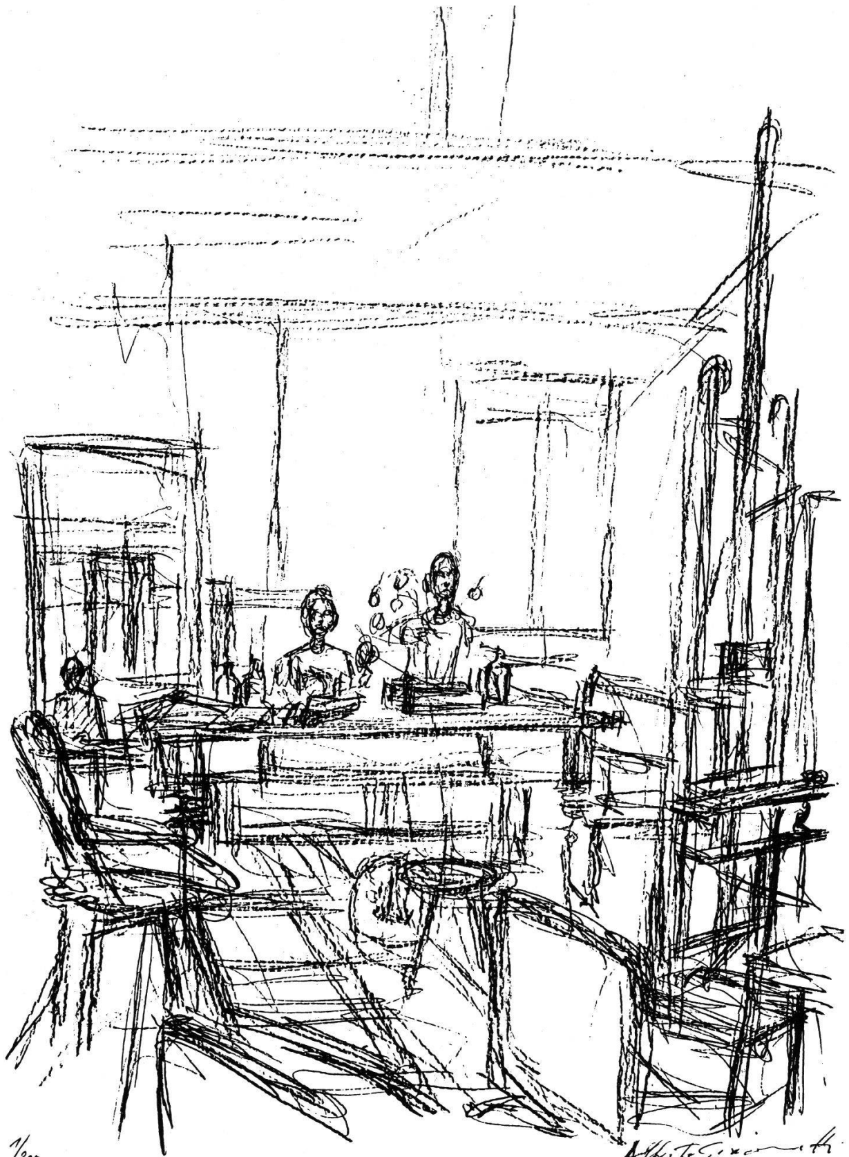
ATELIER, 1965 LITHOGRAPHIE VON ALBERTO GIACOMETTI (1901-1966)