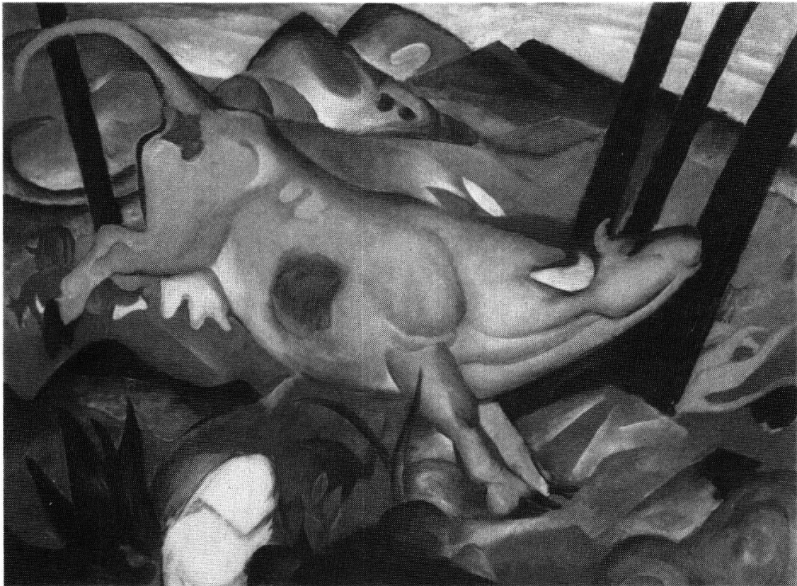
Franz Marc «Die gelbe Kuh», 1911. Öl auf Leinwand, 140x190 cm. The Salomon R. Guggenheim Museum, New York.

und Spektralfarben zu heute etwas seltsam anmutenden Zonen zwischen Idylle und Erhabenheit. Sein Meisterwerk in der Ausstellung ist die «Gelbe Kuh», die als gewaltige Diagonale eine zwei Meter breite Leinwand durchstürmt — und damals prompt von der Kritik als «ganz miserable Arbeit» bezeichnet wurde.