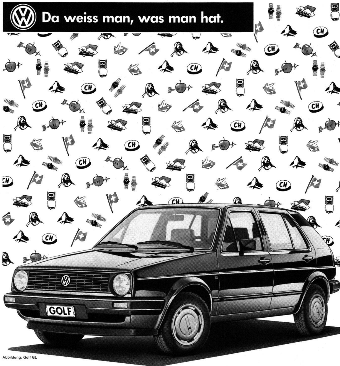
Abbildung: Golf GL