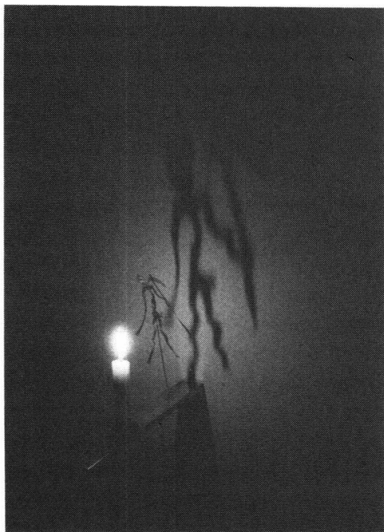
Abbildung 3 Christian Boltanski: Leçon de Ténèbres . 1987. (Finsternisse) Rauminstallation, Verschiedene Materialien mit 30 Kerzen (Ausschnitt). Lampengedämpfte Einschlafbilder aus Gefilden des Anderen.

etwas herangebracht werden muss, was ihnen gegenwärtig fehlt». Er meinte damit etwa Ideenaustausch anstatt Vereinsamung, eine Freiheit, innerhalb derer alle Menschen Gestaltungsvorschläge machen könnten, Wiederherstellung des Gleichgewichts zwischen Vernunft und Mythos.