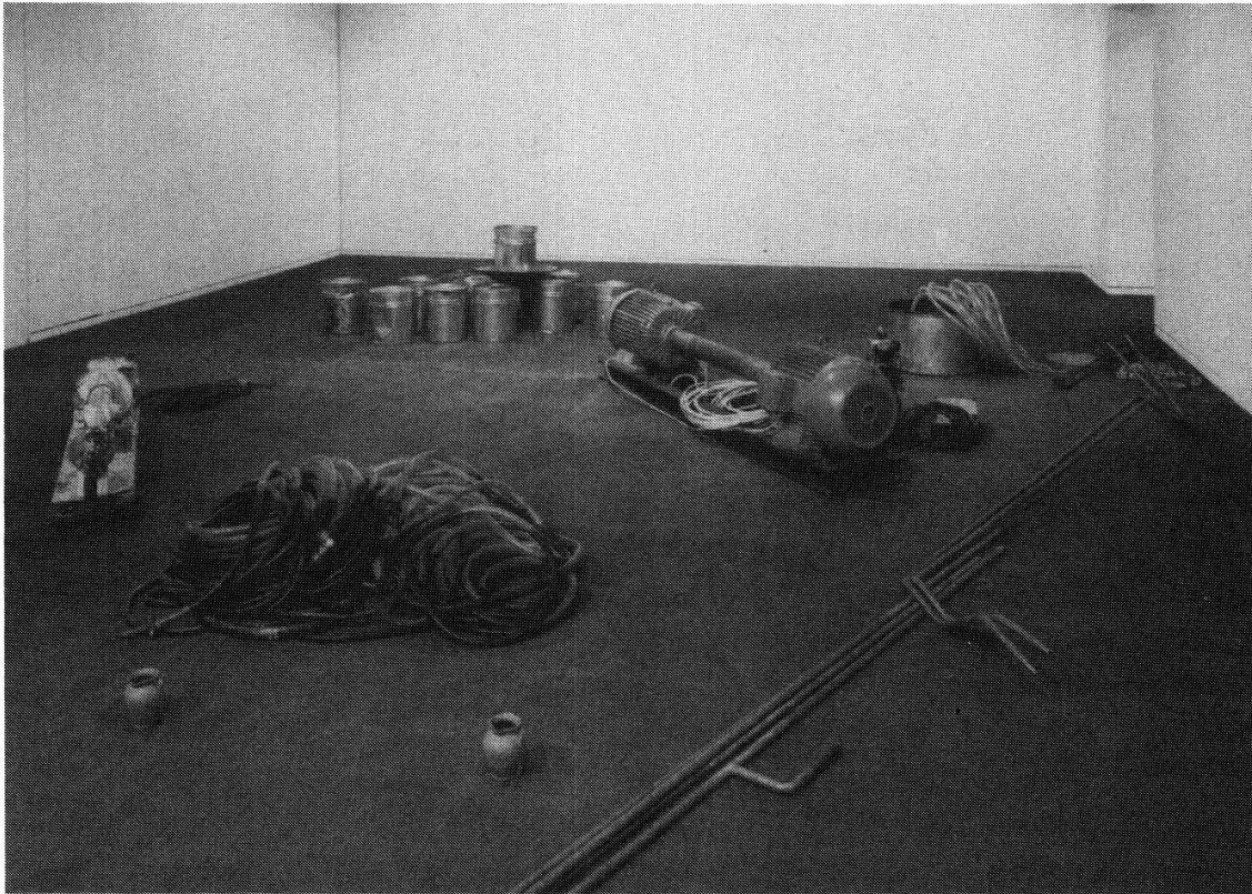
Abbildung 2 Joseph Beuys: Die Honigpumpe am Arbeitsplatz , 1977. Rauminstallation, 2 Schiffsmotoren, 1 Stahlbehälter, Plastikschlauch, 3 Bronze-Gefässe, 2 Tonnen Honig in Kanistern Humlebaek (Dänemark), Museum für Moderne Kunst. Nur noch als Reliquie erlebbar. 1977 zirkulierte Honig durch die Schläuche, Beuys entwickelte sein Modell, wie sich Menschen und Dinge durch Kommunikation finden.

bar erlebbar machen. Wollte man Linien in die Vergangenheit ziehen, käme man vielleicht zu frühesten Kultdarstellungen, zur Romanik, zu Bosch, den Romantikern, dem Blauen Reiter.