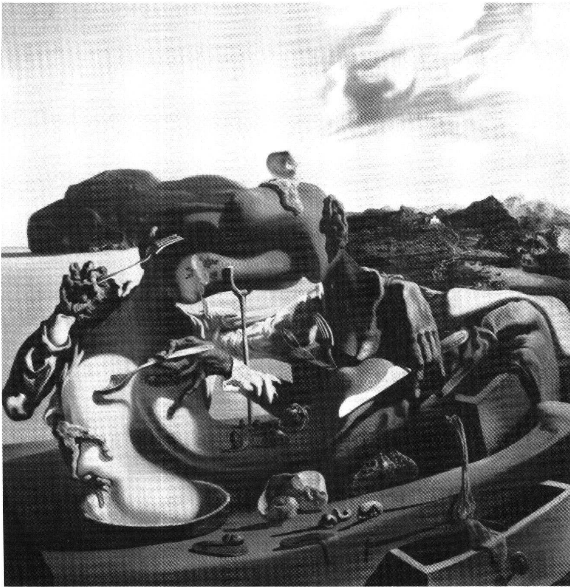
Salvador Dalí, «Herbstlicher Kannibalismus», 1936. Öl auf Leinwand, 65 × 65,2 cm. In einem grauslichen Gelage verwandelt sich ein Paar sukzessive in Esswaren und frisst sich gegenseitig auf. So hat Dalí den Bürgerkrieg in Spanien vorausgesehen: Als «das Nahen des grossen bewaffneten Kannibalismus unserer Geschichte» (aus «Das geheime Leben»).

Menschen an, Dalí wird auch das Zürcher Kunsthaus bald in die Hitliste der Ausstellungen bringen. Vor einem halben Jahrhundert hat er seine Erfolge in gewohnter Hybris und Respektlosigkeit vorausgesagt (aus «Meine Bilder im Herbstsalon» 1927, im jetzigen Katalog abgedruckt): «Sicher ist, dass die Leute sich von meinen Bildern angezogen fühlen wie die Fliegen vom Fliegenpapier,