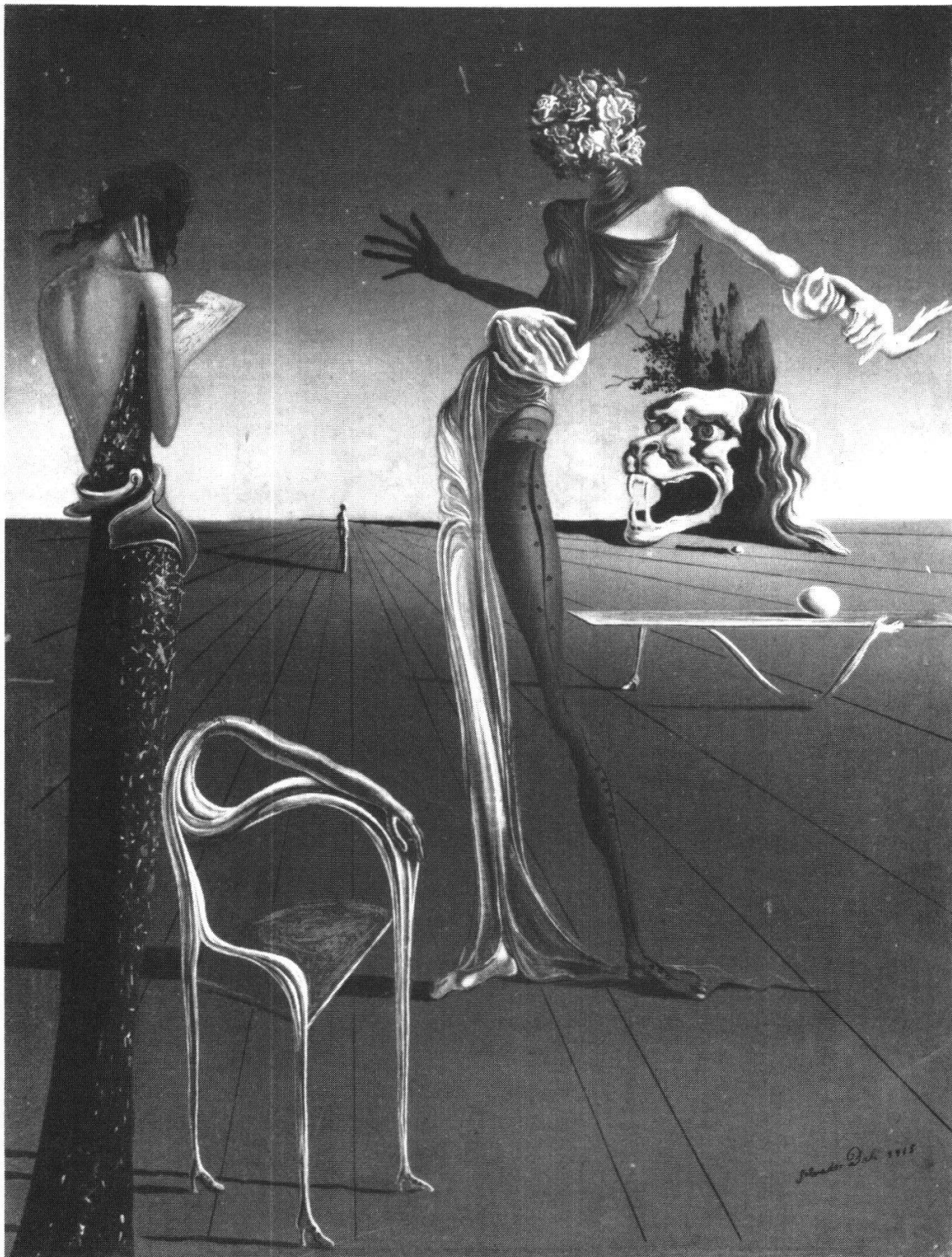
Salvador Dalí: «Frau mit Rosenhaupt», 1935. Öl auf Holz, 35 × 27 cm. Dalí verwischt die Grenze zwischen Kunst und Design. Die Bekanntschaft mit Modeschöpfern wie Coco Chanel oder Elsa Schiaparelli verlockte ihn zu modischen Entwürfen; die leicht surrealen Damen werden zu Mannequins. Dalí schätzte Eleganz höher ein als Schönheit und er liebte die Mode, von der er fand: «Nichts ist tatsächlich tragischer und eitler als die Mode» (aus «Das geheime Leben»). War er nicht selbst ebenso «tragisch und eitel»? Stuhl und Tisch in unserer Abbildung könnten sich gut als richtige Möbel herstellen lassen.