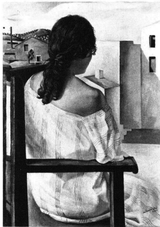
Salvador Dalí, «Junges Mädchen von hinten», 1925. Öl auf Leinwand, 103 × 73,5 cm. Dalí vor Dalí: während seiner Zeit an der Madrider Kunsthochschule malt Dalí seine Schwester und verarbeitet Einflüsse von Vermeer bis Ingres und Carrà. Die sorgsame akademische Malweise hat er auch später nicht aufgegeben.

Die grauenvolle Kinder-Begegnung mit einem verwesenden, von Würmern zerfressenen Igel geistert durchs ganze Schaffen. Der erwachsene Dalí fragt sich, «ob sich hinter den drei grossen Wahrheitsbildern, der Scheisse, dem Blut und der Verwesung, nicht gerade