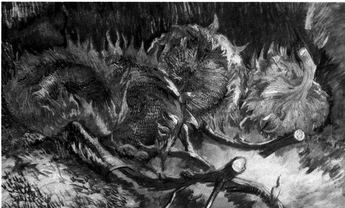
Stilleben mit vier Sonnenblumen (Juli – September 1887, 50 × 60 cm). Lauter kleine Farbteilchen bringen die schweren Köpfe der Sonnenblumen zum Drehen wie Feuerräder.