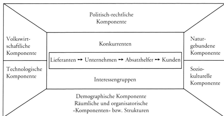
Wichtigste Mitspieler und Gestaltungskräfte im Marketingumfeld

Vom Teilhaben an der Umwelt, an der Kultur, an der Heimat wird der Mensch zum Bestandteil des Habens anderer.