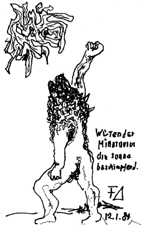
Friedrich Dürrenmatt, Wütender Minotaurus die Sonne beschimpfend, Filzstiftzeichnung, 31 x 22,5 cm.

Bild wiederzugeben. Ein Ablauf, ein Geschehen, lässt sich im Bild nur durch eine List, einen Kunstgriff, wiedergeben: Eines meiner Lieblingsbilder von Braque ist eine Lithographie, die einen Vogel, eine Schwalbe, im Fluge am Vollmond vorbei darstellt. Das Bild einer Sekunde, einer Zehntelsekunde also. Interessant ist für mich die Art, wie es Braque gelingt, das Undarstellbare mittels Kunst darzustellen.