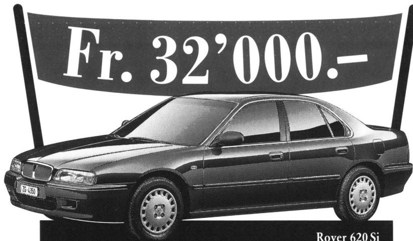
Rover 620 Si