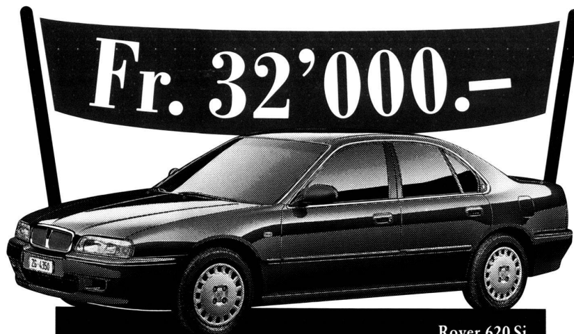
Rover 620 Si